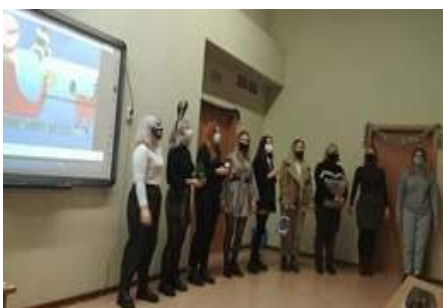
Фрагменты Рождественских встреч

10. 18 декабря состоялась олимпиада по практической грамматике английского языка. Данное мероприятие направлено на выявление уровня сформированности лингвистической компетенции студентов (грамматические навыки и умения). Участниками олимпиады стали 18 студентов I курса факультета славянских и германских языков. Победители олимпиады: