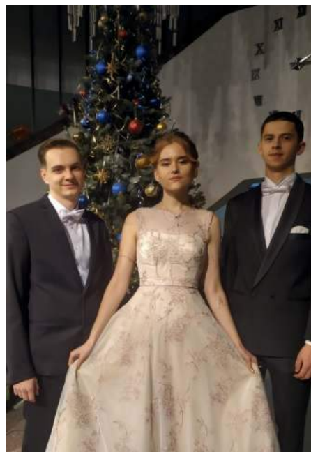
Участники республиканского новогоднего бала

Надеемся, все участники запомнят это грандиозное событие своей жизни навсегда, а напоминать им об этом будут новогодние подарки от Главы государства.