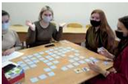
Фрагмент проведения настольной игры на занятиях по немецкому языку

4. 15 декабря состоялось мероприятие «Настольные игры на занятиях по немецкому языку» , организованное преподавателями немецкого языка кафедры теории и практики германских языков и представителями центральной городской библиотеки имени В. П. Тавлая, направленное на формирование профессиональной и лингвистической компетенций студентов, повышение мотивации студентов к изучению немецкого языка. Участниками мероприятия стали 33 студента групп НА-11 и СИЯ-32. Студенты познакомились с разновидностями лексических и грамматических игр, игр, направленных на отработку социокультурного аспекта иностранного языка. Активное участие в игровом образовательном процессе позволило участникам мероприятия убедиться, что игры, отличаясь универсальностью и адаптивностью, являются эффективным средством обучения на занятиях по иностранному языку.