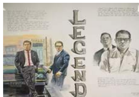
Работы, представленные на конкурс лучших плакатов кинофильмов

12. 18 декабря состоялось воспитательное мероприятие «Учитель, имя твоё восхваляю». Целью мероприятия было формирование позитивного отношения студентов к будущей профессиональной деятельности. В нём приняли участие студенты групп СИЯ-11, СИЯ-12 и СИЯ-13. В ходе мероприятия было предложено поразмышлять над цитатами великих людей о профессии учителя, создать образ идеального и реального учителя, предложить решение для педагогических ситуаций, которые могут возникнуть в профессиональной деятельности, назвать причины, почему быть учителем здорово. Участники мероприятия были полностью вовлечены в процесс обсуждения и извлекли для себя полезные уроки для эффективного осуществления будущей профессиональной деятельности.