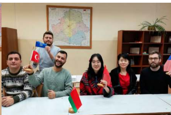
Группа иностранных слушателей, изучающих русский язык