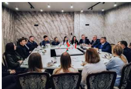
Фрагмент диалоговой площадки