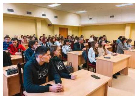
Фрагменты семинара «Успешные практики работы с одаренной молодежью»