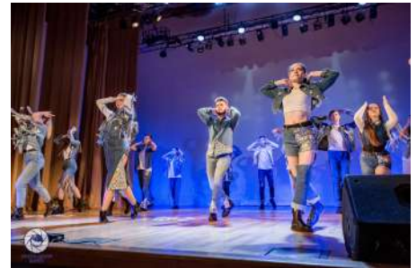
Выступление народного театра моды «Світа»