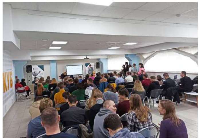
Фрагменты участия в Неделе бизнеса и инноваций «КУБ»