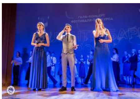
Фрагмент гала-концерта «Таланты БарГУ — 2022»