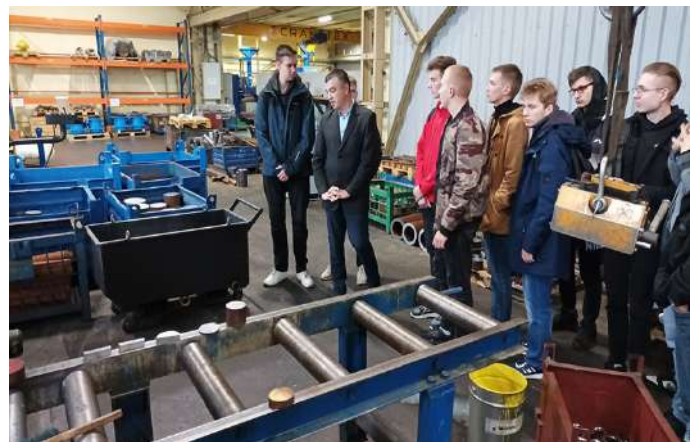
Фрагменты экскурсии по предприятиям «НИВА-ХОЛДИНГ»