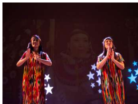
Выступление иностранных обучающихся