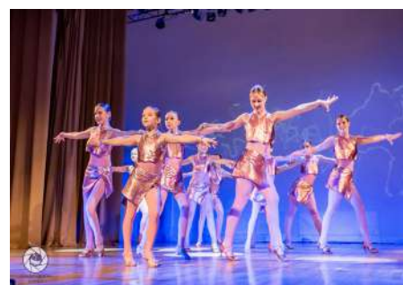
Выступление танцевально-спортивного клуба «Титан»