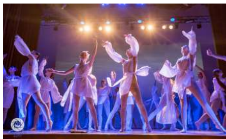
Номинация «Театр моды»