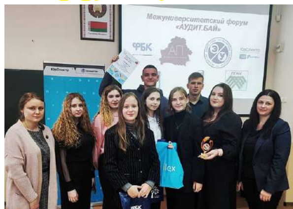
Команда БарГУ на форуме «Аудит.Бай»