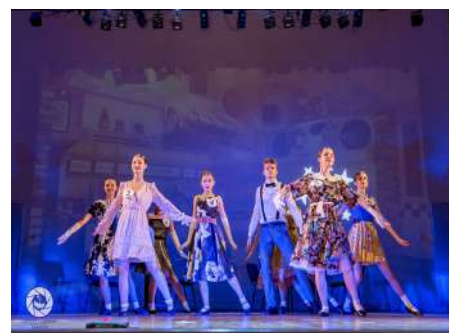
Номинация «Хореографический жанр» (группа современного танца Stand out)