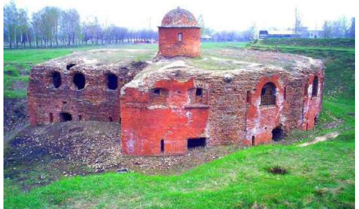
Историческая крепость в городе Бобруйске

Бобруйская крепость внесена в государственный список историко-культурных ценностей Республики Беларусь и отнесена к ценностям республиканского значения.