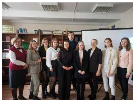
Литературная гостиная «Голоса молодых»