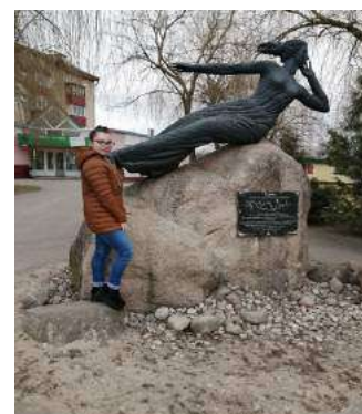
Скульптурная композиция «Вильяна» в Вилейке

Девушка на камне стала еще одной достопримечательностью города, символом его легендарного прошлого и не менее замечательного настоящего.