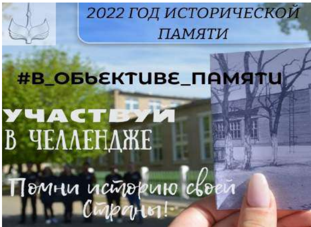
Материал от студентов общежития по ул. Уборевича, 22

На тэрыторыі вёскі Стайкі можна ўбачыць тое, што засталася ад былой сядзібы Лашкевічаў. Яна была пабудавана на мяжы XIX і XX стагоддзяў у стылі мадэрн. Гэта і зараз можна заўважыць па руінах сядзібнага дома: пабудаваны з чырвонай цэглы, ён шмат у чым нагадвае закінуты рыцарскі замак (падабенства яшчэ больш узмацняе кутняя вежа). Таксама захаваліся некалькі гаспадарчых пабудов і фрагменты парка, у якім яшчэ можна ўбачыць старыя дрэвы. Пасля заканчэння Другой сусветнай вайны ў будынку сядзібнага дома знаходзілася школа. Аднак яна была пераведзена ў іншае месца, пасля чаго сядзіба Лашкевічаў у Стайках стала прыходзіць у заняпад.