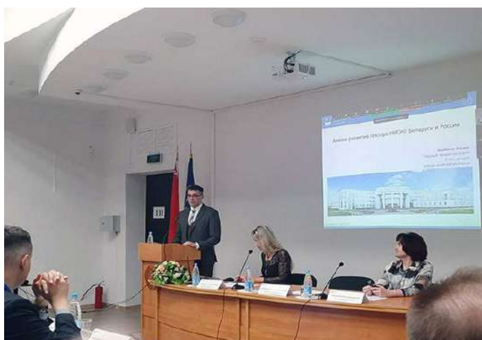
Выступление В. В. Климука с докладом