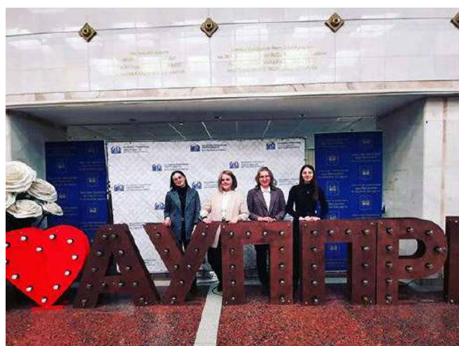
Студенты БарГУ — участники форума