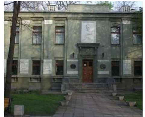
Парк Янки Купалы

Историческую крепость в городе Бобруйске начали строить в 1810 году. Идея о возведении Бобруйской крепости на берегу реки Березины принадлежала военному инженеру Теодору Нарбуту и инженер-генералу графу Карлу Опперману.