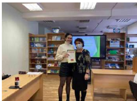
Брейн-ринг «Филология — королева наук»

Завершением Недели кафедры филологии стала литературная гостиная «Голоса молодых», которая прошла 25 февраля 2022 года. Она собрала участников научно-художественного кружка «Геба», которые познакомили присутствующих со своими литературными произведениями. Ежегодно литературная гостиная «Голоса молодых» приглашает известных барановичских творцов.