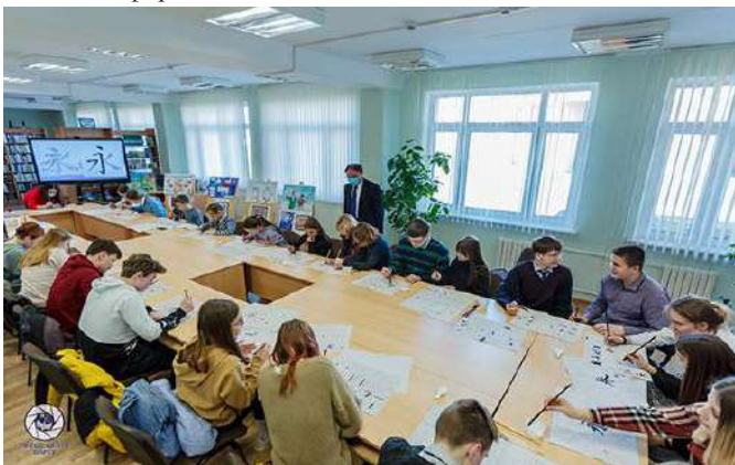
Фрагмент мастер-класса по написанию китайских иероглифов