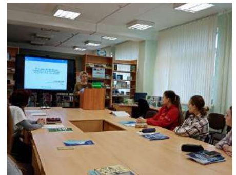
Научно-методический семинар «Первые шаги в науку»