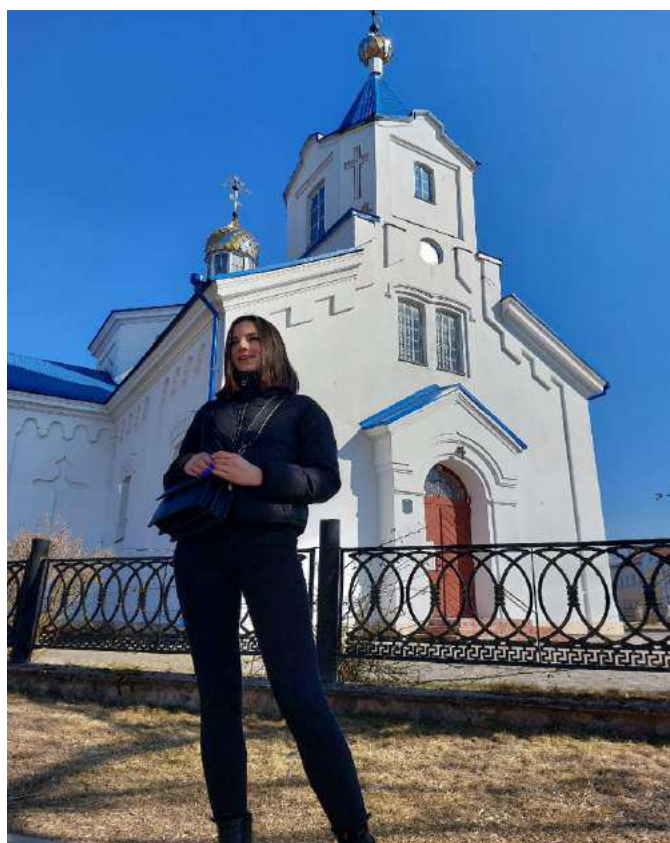
Церковь в Ошмянах

1399 год стал переломным — Ошмяны стали настоящим городом. Нынешний центр города Ошмяны в начале XVI века назывался Новые Ошмяны, и именно там велось активное строительство. А в 1505 году старинная часть города (Старые Ошмяны) перешла во владение францисканцев, они построили там костел и монастырь. Ошмяны славятся своей церковью, ее строительство состоялось с 1873 по 1883 год. Исконный русский стиль отличает это строение. Отправляясь на отдых в Беларусь, ни один турист не проезжает мимо Ошмян. Достопримечательности этого города так и манят отдыхающих, которые приезжают сюда посмотреть не только крепость и синагогу, но и церковь.