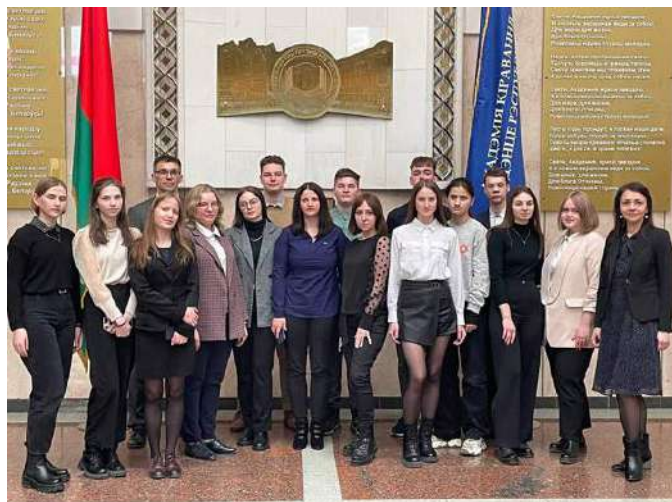
Делегация БарГУ на IV Международном форуме молодых управленцев

ответственный за научную работу на факультете педагогики и психологии