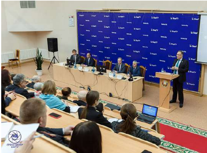
Фрагмент дискуссионной площадки