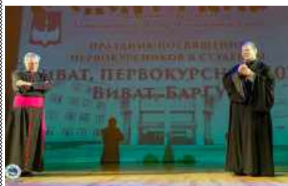
Благословение первокурсников на успешное обучение

педагог-организатор отдела культуры и творчества