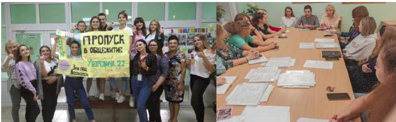
Кампания по заселению в общежитие по адресу: ул. Уборевича, 22

Всем вновь «Добро пожаловать в семью!» Желаем хорошей учёбы и много веселья. Пусть студенческий дом станет для всех счастливиц-студентов вторым родным домом, в котором их ждут новые знакомства, новые увлечения и в целом новая самостоятельная, интересная и динамичная жизнь. Благодарим всех, кто оказывал посильную помощь.