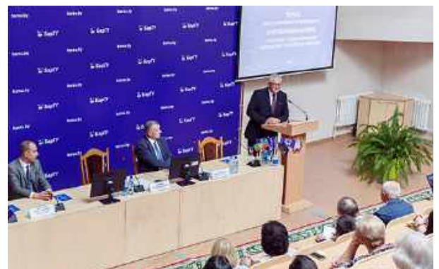
Выступление Министра образования Республики Беларусь И. В. Карпенко

Относительно дистанционного обучения И. В. Карпенко пояснил: «Удаленное обучение не заменит живую лекцию или общение в студенческой группе, занятия, на которых происходит обмен не только знаниями, но и энергией, где молодежь осваивает важнейшие в жизни навыки — коммуникабельность, способность к аргументированному изложению своей точки зрения».