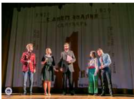
Выступление народного театра миниатюр «Сафіт»

научных лабораторий и кружков, спортивных секций, культурно-творческих объединений.