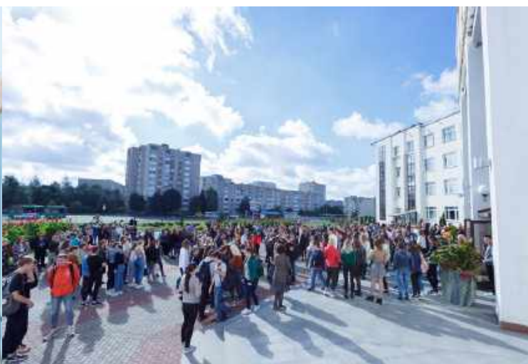
Фрагменты проведения эвакуации