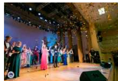
Исполнение гимна БарГУ