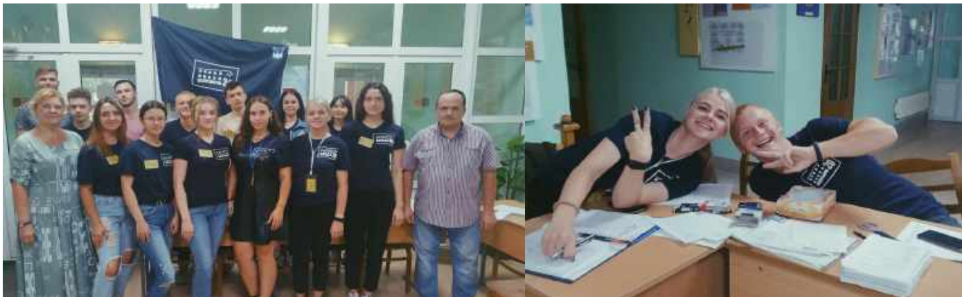
Кампания по заселению в общежитие по адресу: ул. Уборевича, 20

Благодаря слаженной работе студенческих советов общежитий, воспитателей и администрации, всё прошло отлично. Студенты познакомились с правилами внутреннего распорядка в студенческом общежитии, основными правилами безопасности, а также получили ответы на все волнующие вопросы.