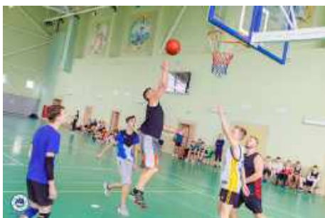
Фрагмент турнира по стритболу