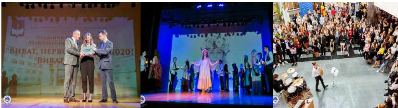
Фрагмэнтэ праздніка «Віваць, перакурснік-2020! Віваць, БарГУ!»