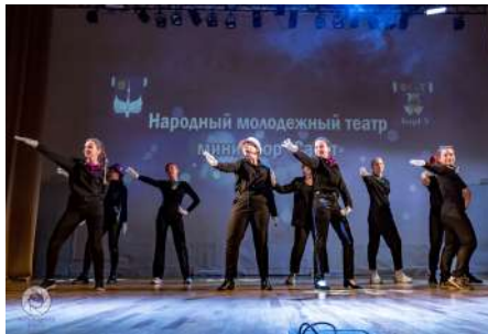
Выступление народного молодёжного театра миниатюр «Сафіт»