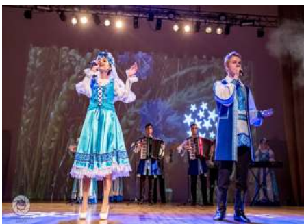
Выступление народного инструментального ансамбля «Музычны гасцінец»

Настоящий праздник, массу положительных эмоций и сюрпризов подарили первокурсникам творческие коллективы университета (народный инструментальный ансамбль «Музычны гасцінец», народный молодёжный театр миниатюр «Сафіт», народный театр моды «Світа», клуб по интересам «Я и гитара», группа современного танца Stand out, народная студия эстрадной песни «Талант»).