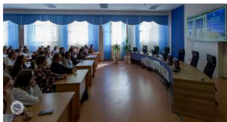
Фрагмент открытого урока «Историческая память — дорога в будущее!»

Стартовой площадкой праздничной программы стал открытый урок в онлайн-формате «Историческая память — дорога в будущее!» с участием Главы государства Александра Григорьевича Лукашенко. Президент Беларуси встретился со студентами учреждений высшего образования и учащимися учреждений общего среднего образования во Дворце Независимости.