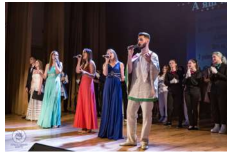
Исполнение гимна БарГУ

Финальным аккордом праздничного концерта стало совместное исполнение гимна БарГУ.