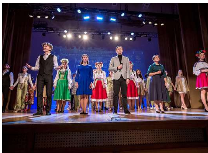
Фрагменты концертной программы