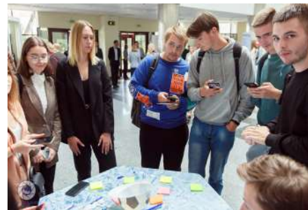
Фрагменты атриум-брейка «А вот и я, и мои новые друзья»