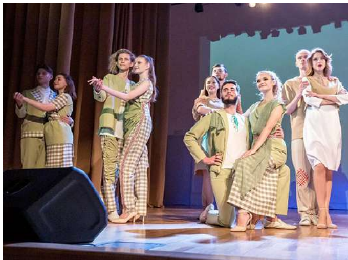
Народный театр моды «Світа»