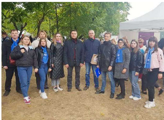
Студенты и преподаватели БарГУ с Министром образования Республики Беларусь А. И. Иванцом

В рамках фестиваля студенты и преподаватели факультета педагогики и психологии (секции технологии и изобразительного искусства кафедры педагогики и социально-гуманитарных дисциплин) провели мастер-класс с демонстрацией возможностей использования традиционных техник декоративно-прикладного творчества в процессе патриотического воспитания обучающихся. Участники мастер-класса в интерактивной форме познакомились с особенностями белорусского национального костюма и традиционной обработки текстиля, получили возможность освоить техники ткачества поясов, приняли участие в игровых формах, где узнали о символике белорусского орнамента.