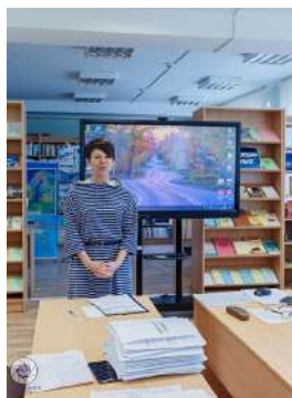
Фрагменты методического семинара «Идеологическая и воспитательная работа в высшей школе: современные требования, подходы, пути решения»