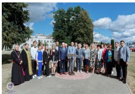
Фрагмент открытия памятного знака «Алея гонару БарДУ»

Памятный знак установлен на аллее, созданной на территории университета по ул. Парковой, 62, как дань исторической памяти университета, выражение благодарности и почта работникам и гостям университета за внесенный ими весомый вклад в развитие университета, восстановление природного баланса и экологии, озеленение территории университета через создание и поддержание паркового массива, обеспечение наиболее комфортных условий для жизни и отдыха молодежи, дополнительной зоны рекреации с формированием общественно полезной традиции — высадки деревьев.