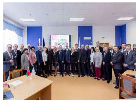
Фрагменты диалоговой площадки «Единство. Истина. Будущее»