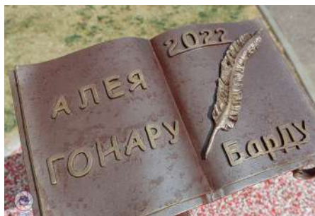
Памятный знак «Алея гонару БарДУ»

Сюрпризным моментом праздничной программы «Виват, первокурсник-2022! Виват, БарГУ!» стало официальное открытие памятного знака «Алея гонару БарДУ».