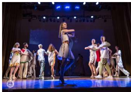
Выступление народного театра моды «Світа»