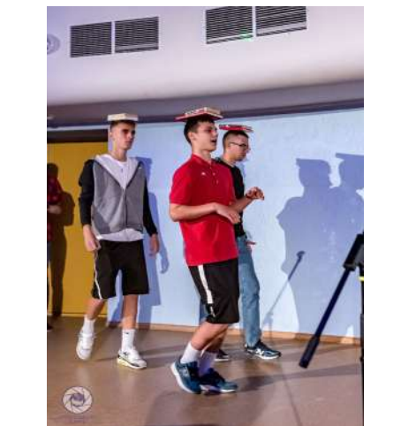
Фрагменты культурно-досуговой программы «Штурмуем танцпол»