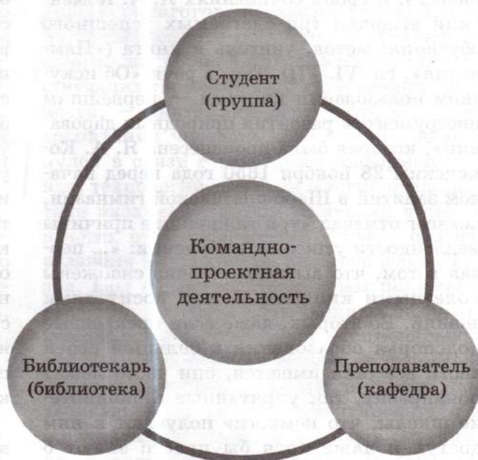
Рисунок — Командно-проектная деятельность в учреждении высшего образования

информационно-образовательный проект «Королева живого слова» был посвящён 175-й годовщине со дня рождения известной писательницы Элизы Ожешко. Как показала практика, командная работа в рамках проекта позволила воплотить в жизнь замыслы всех партнёров — субъектов взаимодействия: группы студентов-филологов, сотрудников кафедр педагогики, филологии и библиотеки Барановичского государственного университета (БарГУ). В рамках проекта прошёл литературный вечер в форме диалога-кафе в усадьбе Бохвицей в деревне Флерьяново Ляховичского района Брестской области, где некогда отдыхала Э. Ожешко. Студенты инсценировали отрывок из её произведения «Хам», представили творческие отчёты по про-